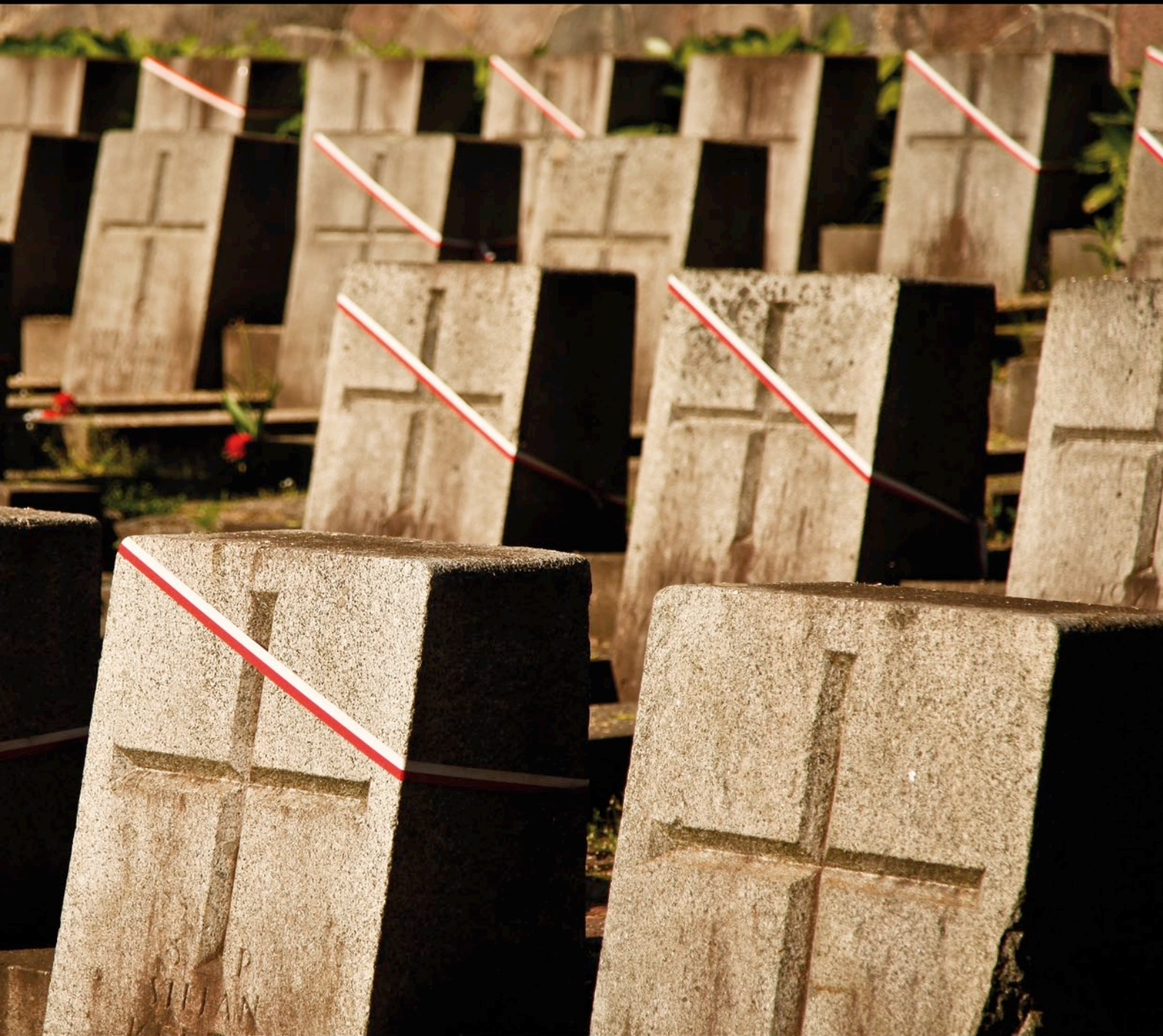
Cmentarz na Rossie - Wilno