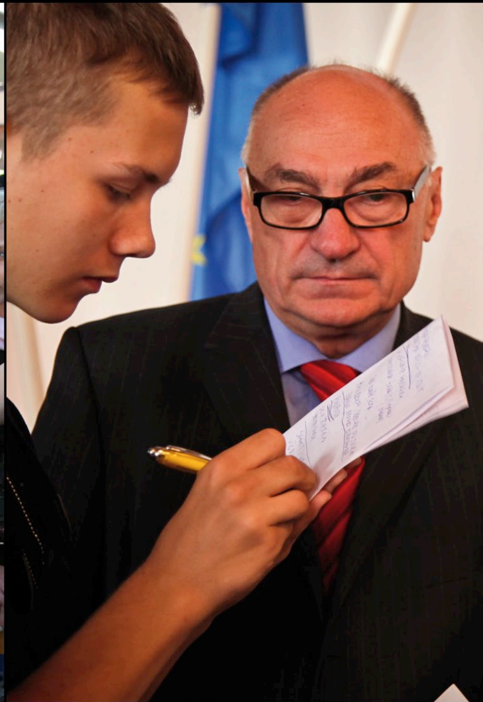
Spotkanie z Ambasadorem RP w Wilnie