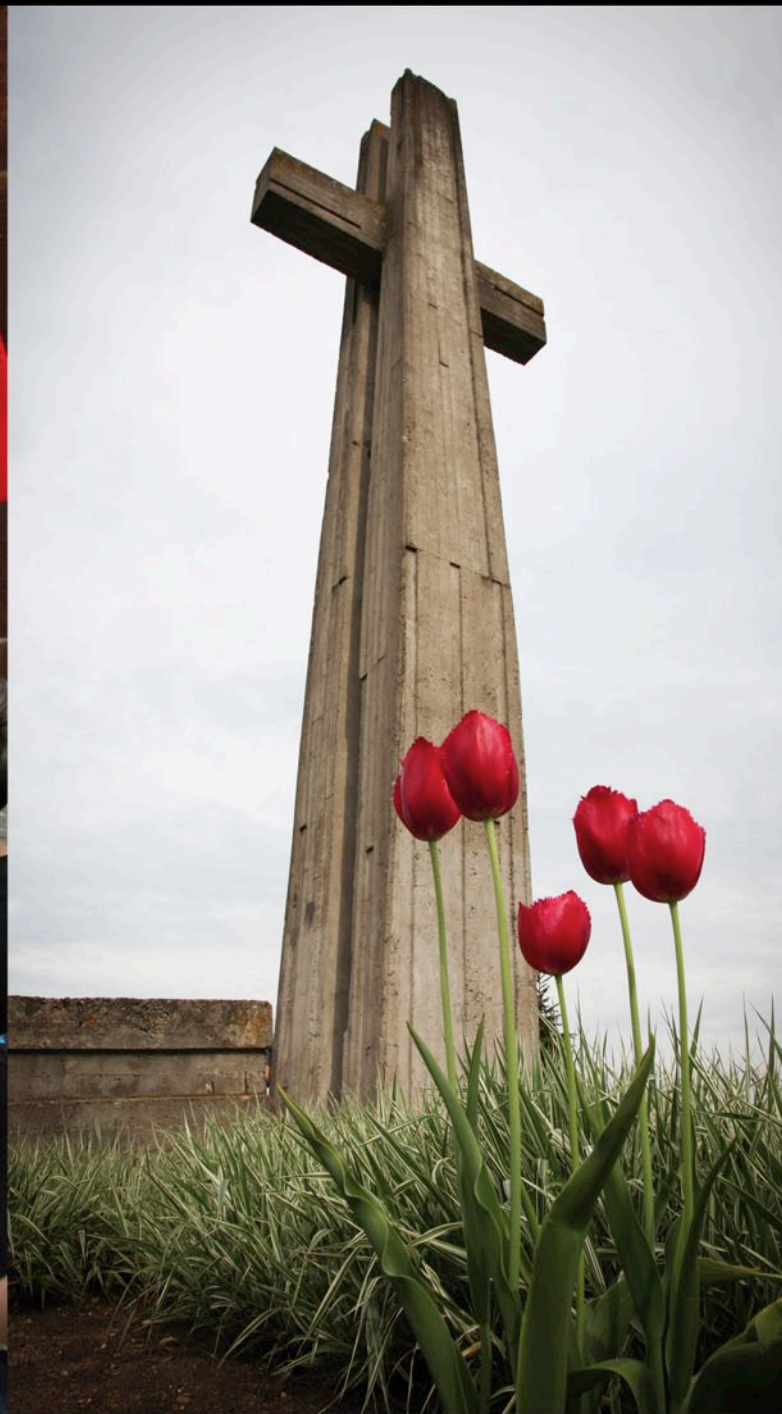
Daugavpils - Lotwa