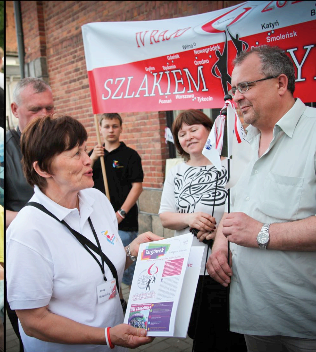
Spotkanie w Domu Polskim w Daugavpils - Łotwa