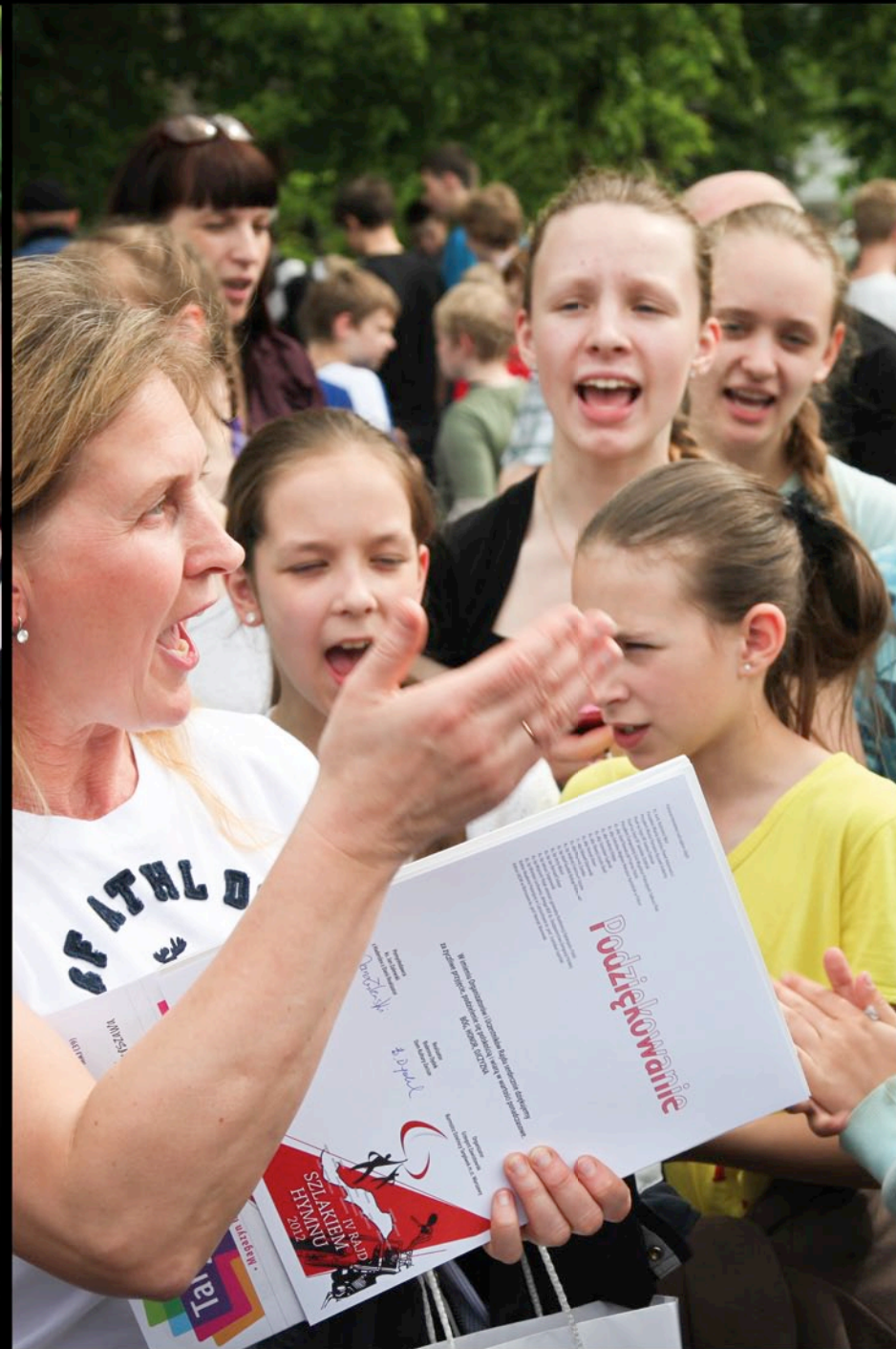
Spotkanie z uczniami polskiej szkoły w Daugavpils