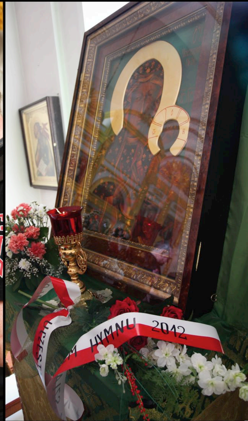
Klasztor w Ostaszkwie