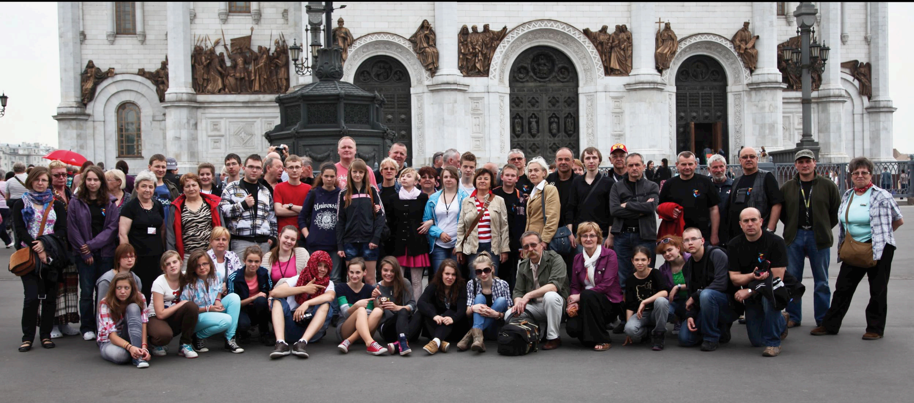
Uczestnicy Rajdu w Moskwie