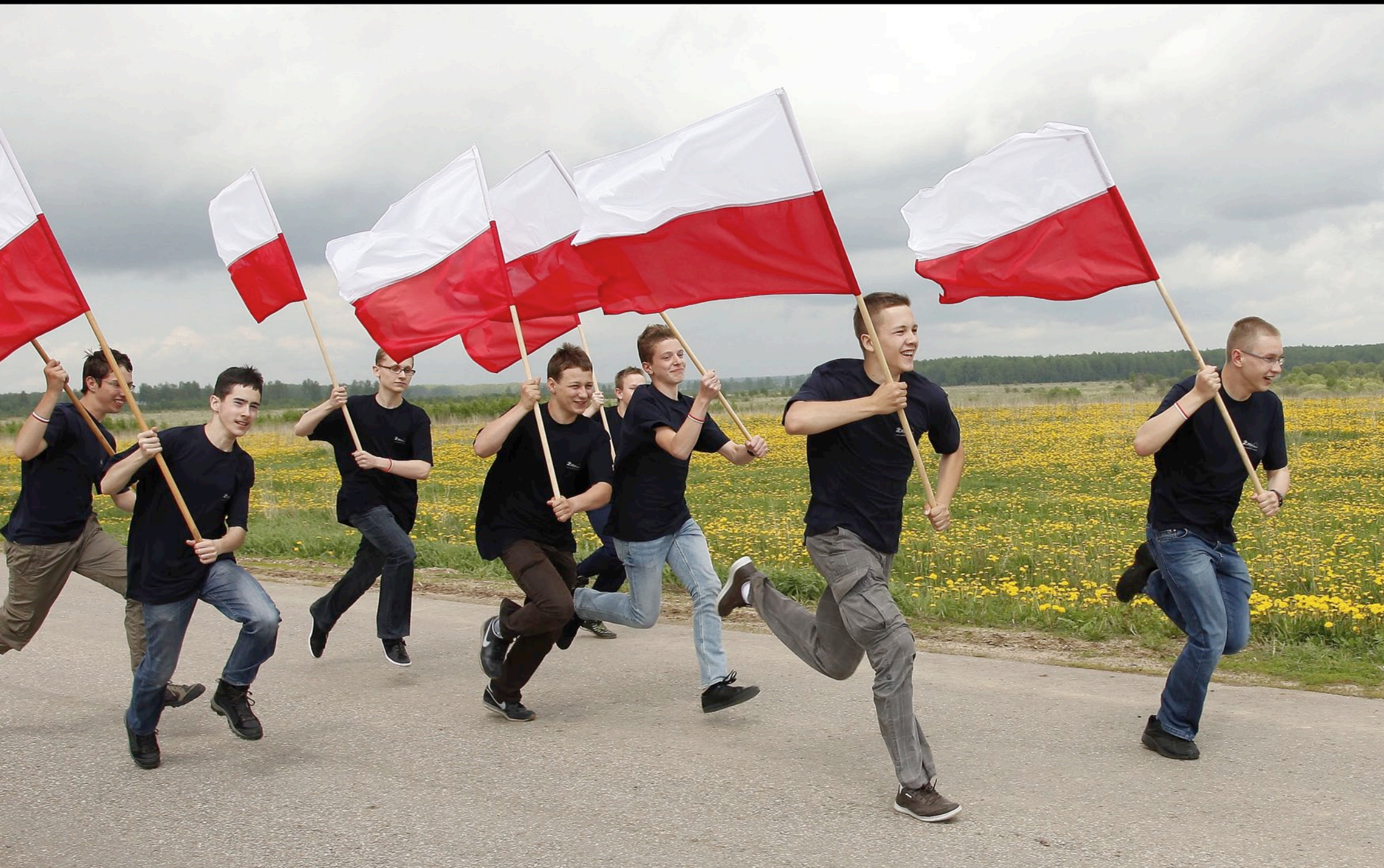
Uczestnicy Rajdu w Kluszyńcu