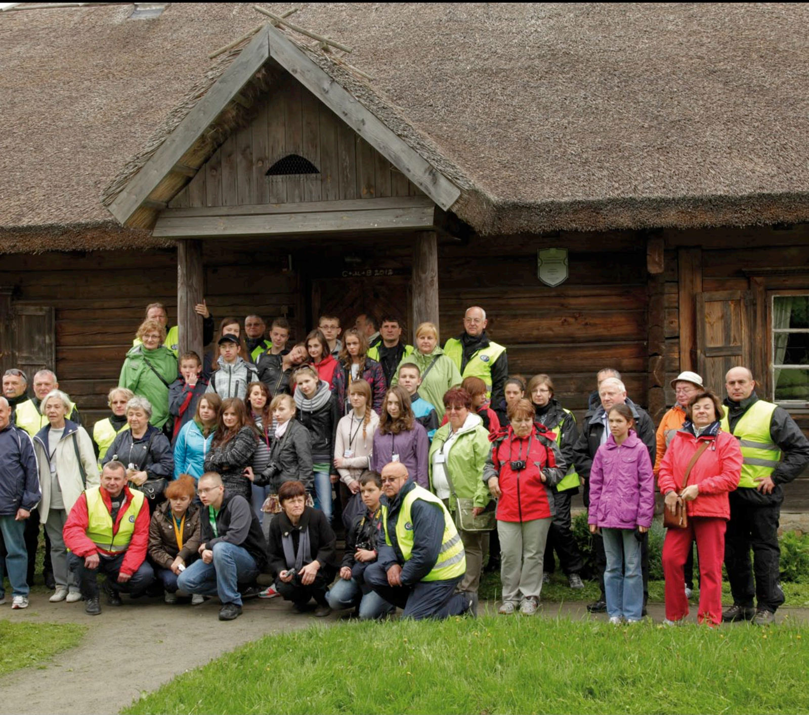
Zaose miejsce urodzin Adama Mickiewicza