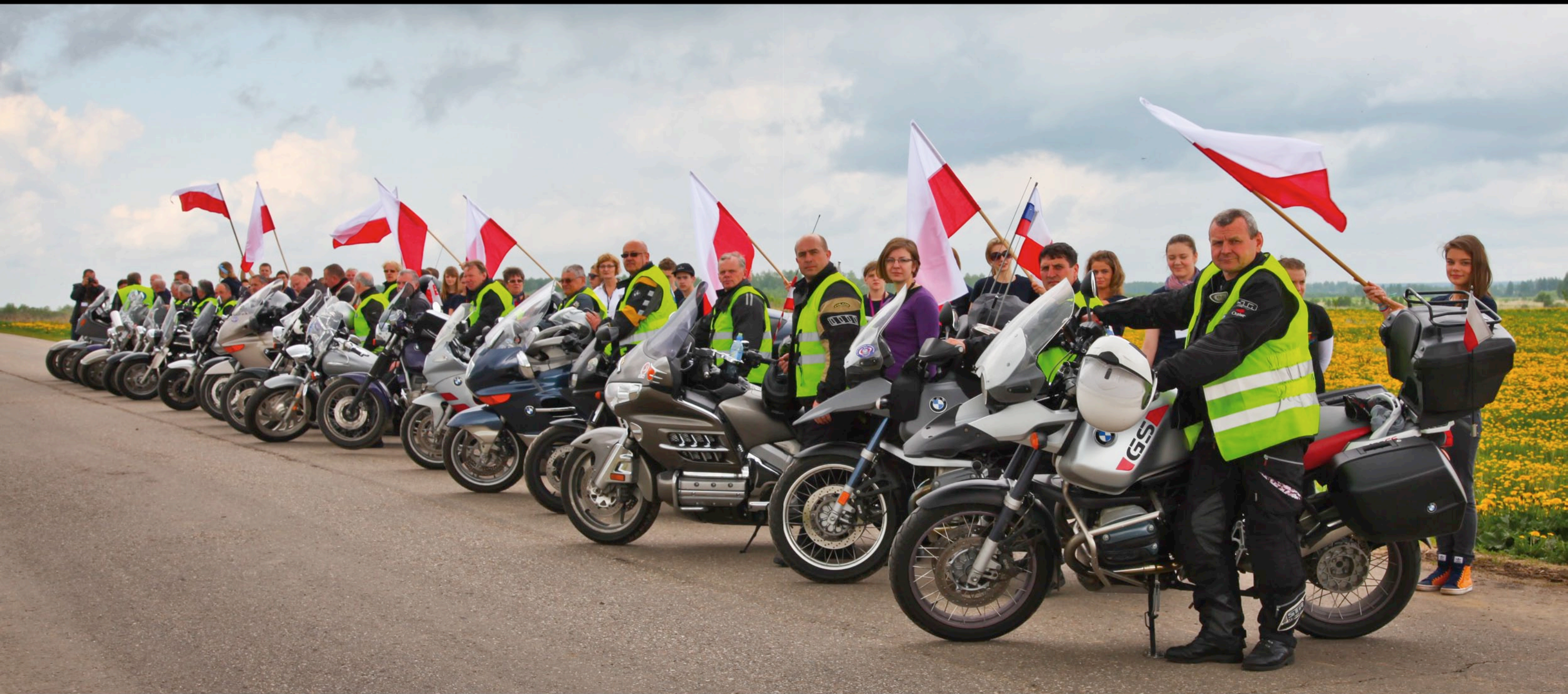
Uczestnicy Rajdu w Kluszyńie