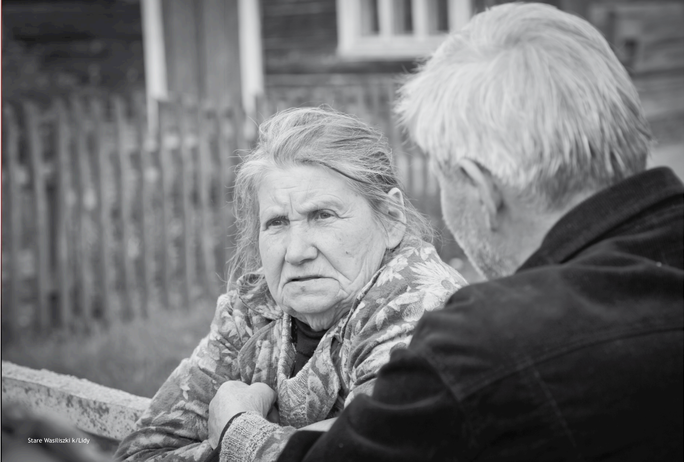
Stare Wasiliszki k/Lidy