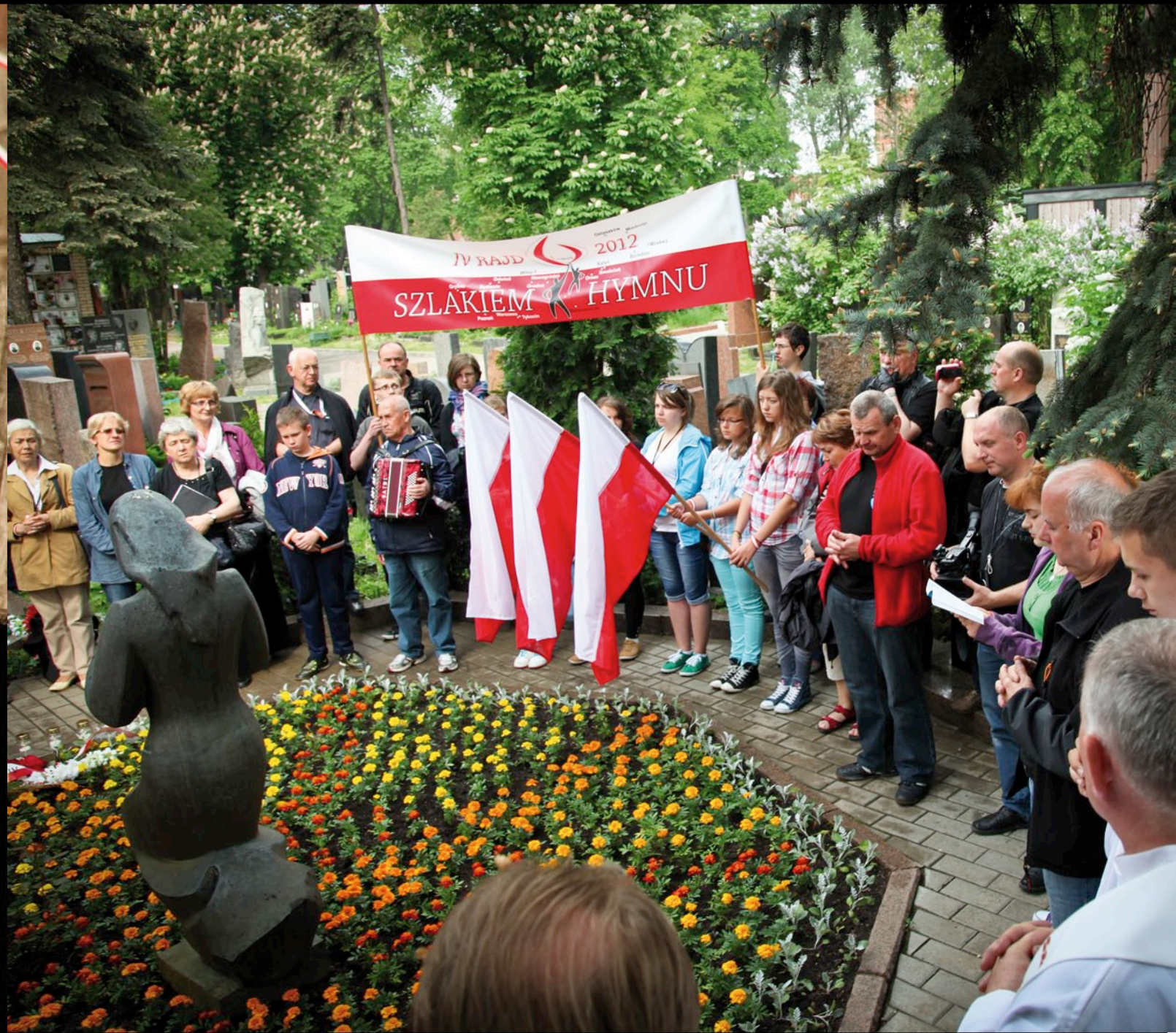
Cmentarz Daniłowski - Moskwa