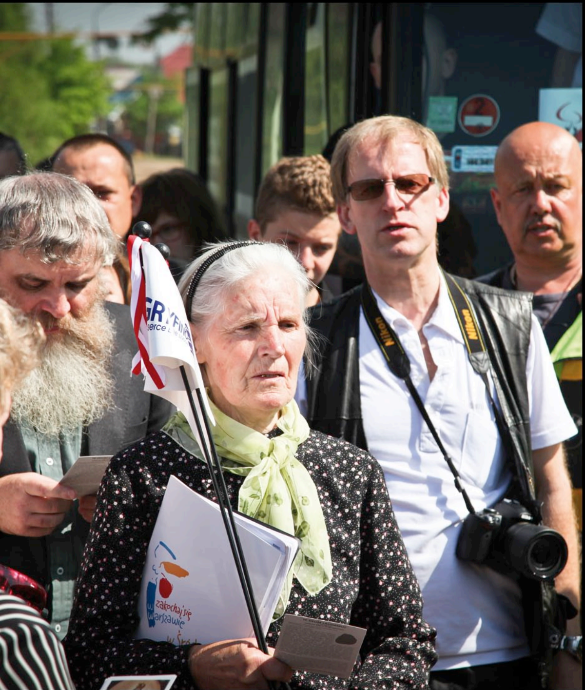
Spotkanie w Wielkich Łukach - Rosja