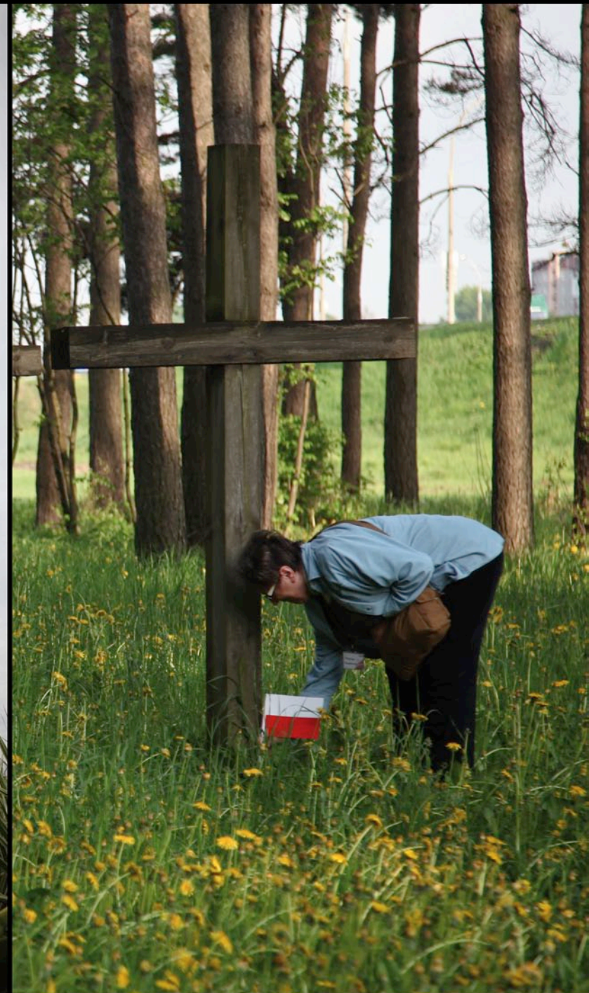
Kuropaty - Białoruś