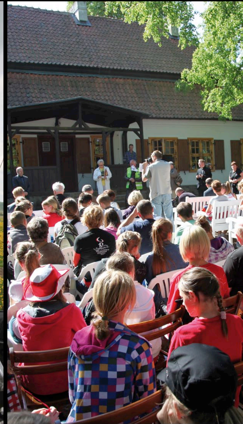
Muzeum Hymnu Narodowego w Będminie k/Gdańska