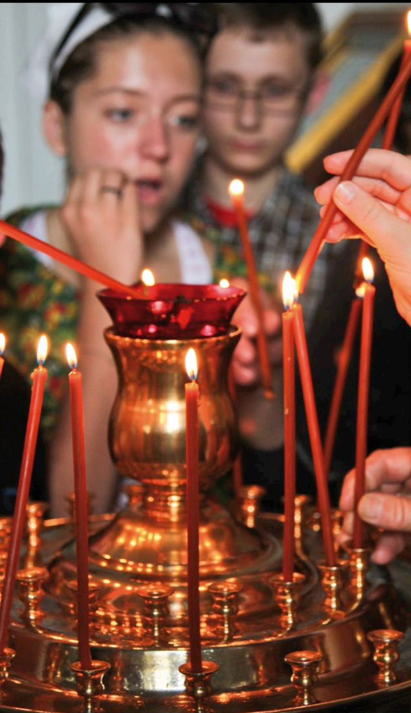
Klasztor w Ostaszkwie